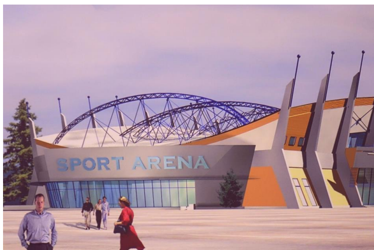
Wizualizacja hali widowiskowo-sportowej w Nysie

Nysa – trzecie co do wielkości miasto w woj. opolskim położone między Dolnym a Górnym Śląskiem w rejonie Przedgórze Sudeckiego nad malowniczym Jeziorem nyskim