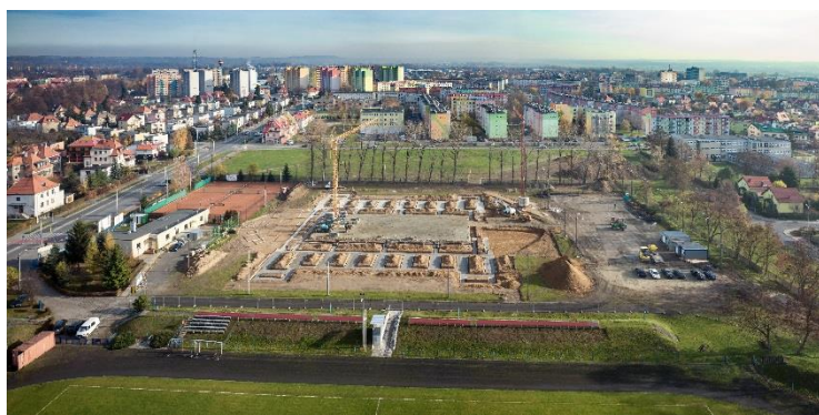
Teren budowy hali widowiskowo-sportowej i hotelu w Nysie