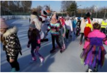
Zdjecia z Balu Przebierańców 2019