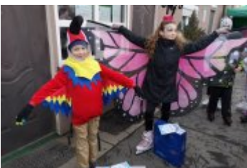
Zdjecia z Balu Przebierańców 2019