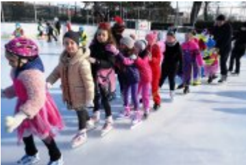
Zdjecia z Balu Przebierańców 2019