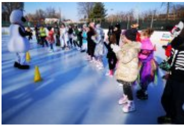
Zdjęcia z Balu Przebierańców 2019

W ramach akcji „Zima w Gminie 2019”, Agencja Rozwoju Nysy zorganizowała dla dzieci i młodzieży na sztucznym lodowisku w Nysie przy ul. Kraszewskiego 2, imprezę rekreacyjno – sportową „Bal Przebierańców”.