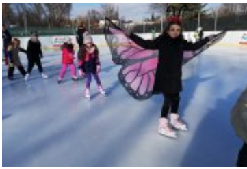
Zdjęcia z Balu Przebierańców 2019