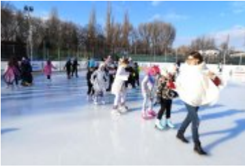
Zdjecia z Balu Przebierańców 2019