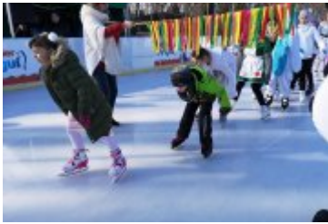
Zdjęcia z Balu Przebierańców 2019