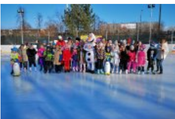
Zdjecia z Balu Przebierańców 2019