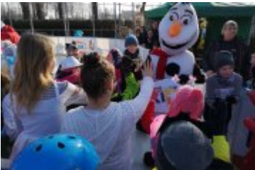
Zdjecia z Balu Przebierańców 2019