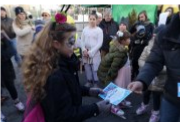
Zdjecia z Balu Przebierańców 2019