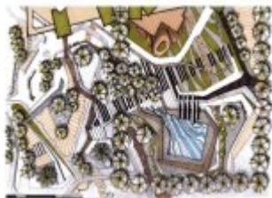
Konceptcja zabudowy Stadionu Miejskiego

Prezentujemy trzy koncepcje architektoniczno-urbanistyczne inwestycji mieszkaniowej wraz z inwestycjami towarzyszącymi. Przedstawiamy zmiany sposobu użytkowania w ramach rewitalizacji terenu Stadionu Miejskiego "Stali Nysa" przy ul. Kraszewskiego w Nysie, na rzecz zabudowy wielorodzinnej, o podwyższonych standardach zamieszkania, z przedszkolem trzy oddziałowym oraz kortami tenisowymi i lodowiskiem Agencji Rozwoju Nysy. Opracowanie powstało na zamówienia Gminy Nysa i ARN, autorem jest Instytut Terytorialnego Rozwoju eRegionu Nysa APPA Archikon DOBROWOLSKI.