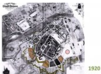
Konceptcja zabudowy Stadionu Miejskiego