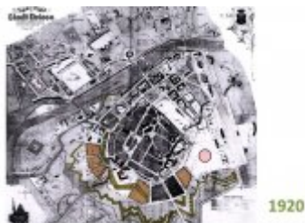
Koncepcja zabudowy Stadionu Miejskiego