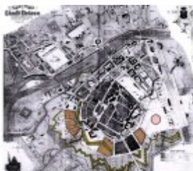
Koncepcja zabudowy Stadionu Miejskiego