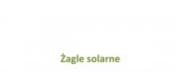
Koncepcja zabudowy Stadionu Miejskiego - cz. II