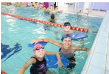
Nyska Szkoła Pływacka ARN

zobacz galerię: Zlot Food Trucków 2020-09-21