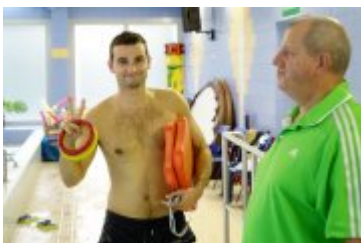
Nyska Szkoła Pływacka ARN