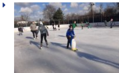
Ferie 2020 na sportowo

zobacz galerię: Pingwin Charli z Kinder Pingui na Lodowisku 2020-02-09