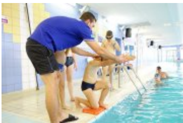
Nyska Szkoła Pływacka ARN