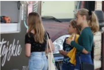
Zlot Food Trucków

zobacz galerię: Koncepcja zabudowy Stadionu Miejskiego - cz. II 2020-06-30