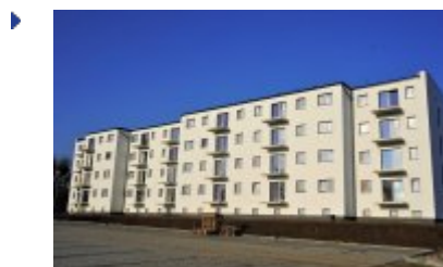
Nowe osiedle na Franciszkańskiej