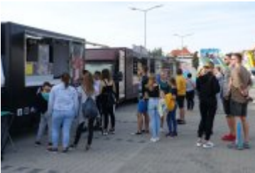
Zlot Food Trucków