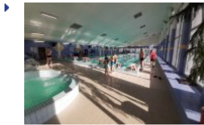
Ferie 2020 na sportowo