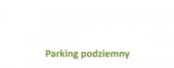
Koncepcja zabudowy Stadionu Miejskiego - cz. II