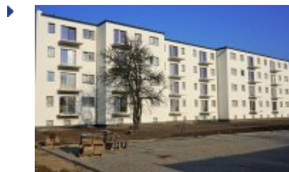
Nowe osiedle na Franciszkańskiej