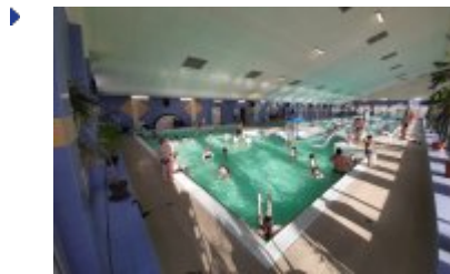
Ferie 2020 na sportowo