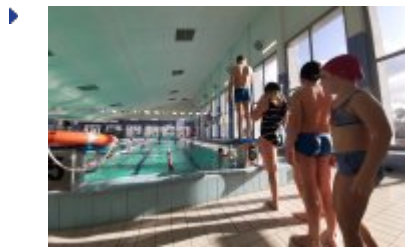
Ferie 2020 na sportowo