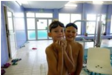
Nyska Szkoła Pływacka ARN