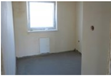
Nowe osiedle na Franciszkańskiej

zobacz galerię: Nyska Szkoła Pływania ARN 2020-09-25